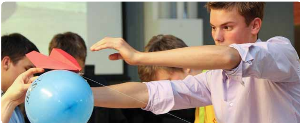
Projektit ovat oiva tapa harjoitella ryhmätyöskentelyä.

• Raportointi: Raportissa kerrotaan mitä on tehty, ja onko asetetut tavoitteet saavutettu sekä mihin lopputulokseen päästiin tai mitä kehitettiin. Hyvä raportti on selkeästi jäsen- nelty ja johdonmukaisesti etenevä kokonaisuus.