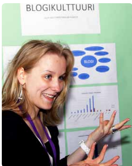
Avoimuus, innostuneisuus ja iloisuus saavat kuulijankin innostumaan ja kiinnostumaan työstäsi.

Sanonta ”yksi kuva kertoo enemmän, kuin tuhat sanaa” pätee myös posterin kohdalla. Kaikkiin kuviin liitetään selittävä kuvateksti ja mainita joko kuvan yhteydessä tai marginaalissa kuvien tekijästä/tekijöistä. Tekijää ei yleensä tarvitse mainita jos kuvat ovat työn tekijän omia. Jos kuvissa, videoissa tai esityksissä on muita ihmisiä, on hyvän tavan mukaista pyytää heiltä lupa esitykseen. Kuvissa tai esityksissä ei saa olla mitään loukkaavaa, eikä ketään fyysistä tai aineellisen merkin omistajaa saa loukata (hyvä tapa on, että posterilla ei mainosteta sponso-reita tai kaupallisia tuotteita). Eri värien ja fonttien käyttö on suositeltavaa, mutta kummassakin kolmea voi pitää optimina.