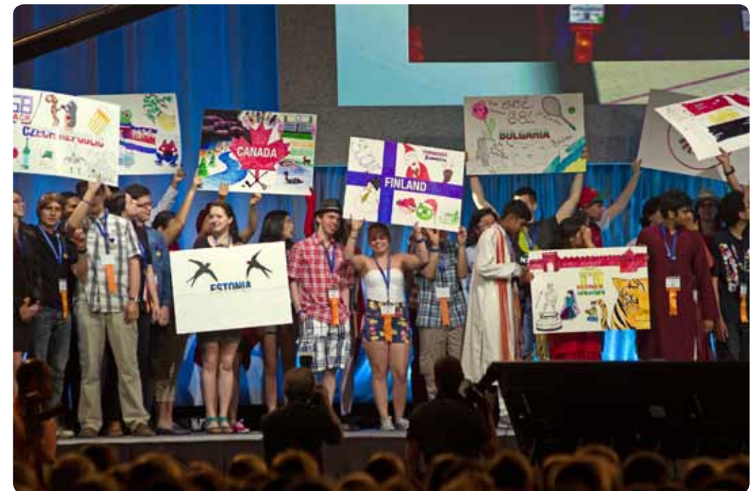
Intel ISEF kilpailuun osallistuu vuosittain lähes 1600 nuorta reilusta 70 valtiosta – se on ainutlaatuinen mahdollisuus tehdä tuttavuuksia ympäri maailman.

Kun pääsee esittämään työtä johonkin tiedekilpailuun, voi olla varma, että kaikilla kilpailuun osallistuvilla on jotain yhteistä: he ovat kiinnostuneet asioiden tutkimisesta ja he ovat uteliaita. Kilpailu on siis oivallinen paikka luoda tuttavuuksia jopa ympäri maailman. Moni kilpailu on rakennettu siten, että oman alueen kilpailusta pääsee jatkoon valtakunnalliseen kilpailuun ja sieltä on mahdollisuus päästä eteenpäin kansainvälisiin kilpailuihin.