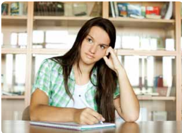
Tutkimus ei ole aina pelkkää tekemistä. On hyvä käyttää aikaa myös ajattelemiseen.

Kilpailutilanteessa voi löytää itsestään uusia puolia – sellaisia tietoja ja taitoja tai luonteenpiirteitä, joita ei tiennyt olevan olemassa. Samalla osallistuminen kehittää itseluottamusta ja auttaa hyväksymään oman itsensä kaikkine puutteineen.